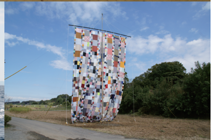
上段：北澤潤《リビングルーム》2010年