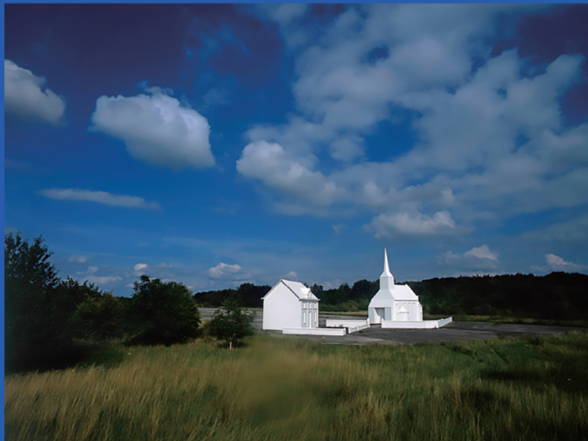
The Village (2011)

テントを敷いたり組み立てたりといった協働作業や、レクチャー・ワークショップなど、秋田に不時着してしまったヘルトと秋田に住む私たちが交流するプログラムを用意しています。秋風の気持ち良い秋田市文化創造館のお庭での新たな出会いを通じて、偶発的に巻き起こるコミュニケーションを一緒に楽しみませんか?